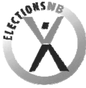
TABLE OF CONTENTS TABLE DES MATIÈRES