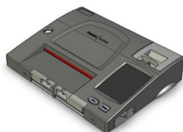
Machine à compilation

Le superviseur du scrutin doit s'assurer que le rapport complet des résultats est retourné au bureau du directeur du scrutin avec la machine à compilation. L'agent de la machine à compilation des votes conserve la dernière (deuxième) section du rapport des résultats au cas où la machine serait abîmée au cours du trajet vers le bureau du directeur du scrutin.